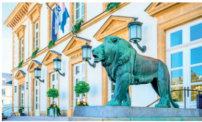
2 Hôtel de Ville