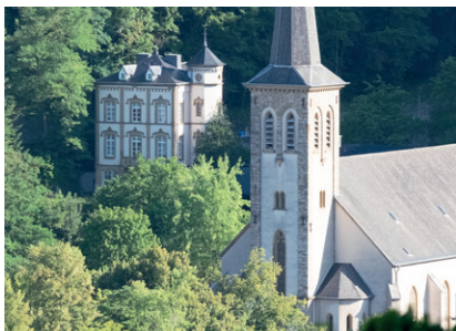
11 Maison natale de Robert Schuman