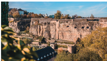
9 Rocher du Bock