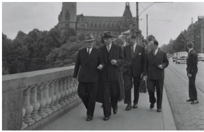
Déclaration du 9 mai 1950 (Robert Schuman ensemble avec Jean Monnet, tous les deux à l'origine de la Communauté européenne du Charbon et de l'Acier)