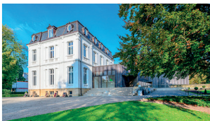
5 Villa Vauban