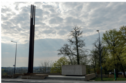
8 Monument Robert Schuman