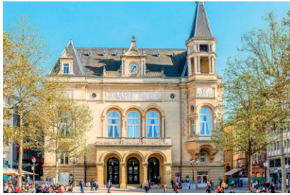
1 Cercle Municipal