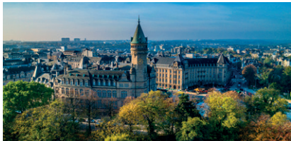
4 Bâtiment de la Banque et Caisse d'Épargne de l'État (BCEE)